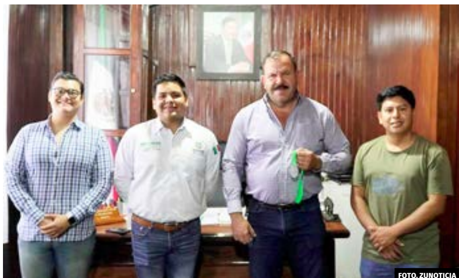
● Jesús Adolfo Rubio Velázquez, titular del INPOJUVE, se reunió con el alcalde Luis Fernando Herbert.

Señaló que este evento es solo una parte del esfuerzo continuo del Ayuntamiento para involucrar a los jóvenes en actividades que les permitan desarrollarse, recalcando que, desde el INPOJUVE se enfatiza la importancia de estar presentes en cada rincón del estado, colaborando con los municipios para llevar más apoyos y oportunidades a la juventud.