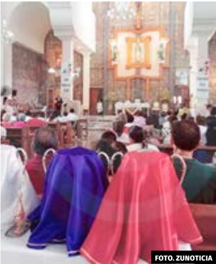
● En su mensaje, el obispo exhortó a los presentes a continuar siendo una buena comunidad para los pobres, un refugio para quien sufre, y un lugar de solidaridad cristiana.

En la celebración de la Misa Crismal, presbíteros de los diferentes municipios de la Huasteca realizaron la renovación de promesas sacerdotales para continuar siendo fieles al ministerio que los recibió.