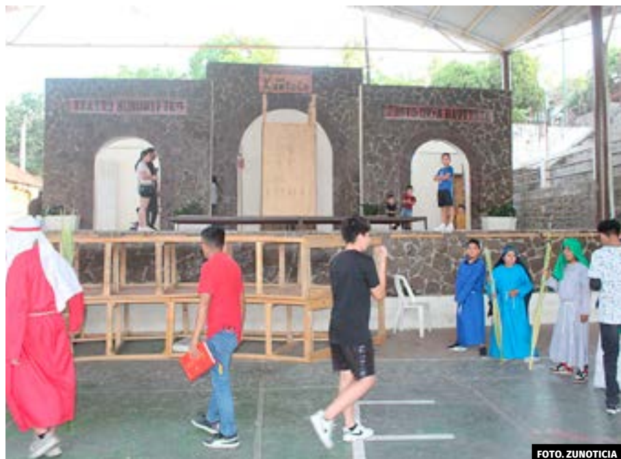
● Los ensayos se llevan a cabo en auditorio Justo Orta, donde se realizará la misa.