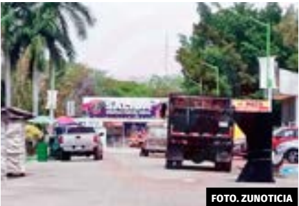
● Debido a la gran afluencia que se espera para este jueves en la FENAHUAP, se adecuaron varias salidas de emergencia.

Las rutas de evacuación fueron marcadas con flechas verdes sobre el piso y se encuentran ubicadas a un costado del Teatro del Pueblo (salida a calle Aire), por el área de los juegos mecánicos (casi a un costado de la Secundaria Pedro Antonio Santos Rivera); el acceso a la avenida Ciro Purata (por la