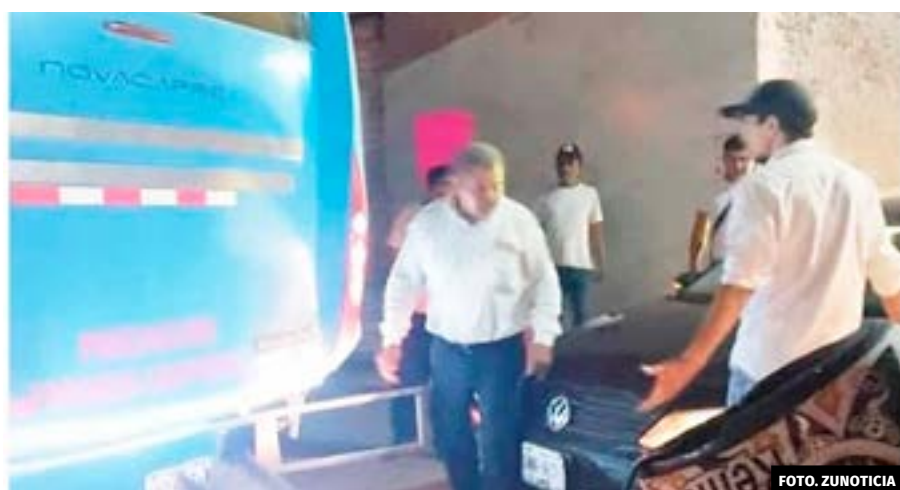
● Aparatoso choque dejó solo daños materiales el Coppel