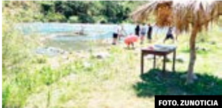
● Construyeron 15 palapas, un muelle y un set para tomar la fotografía del recuerdo.

Refirió que encontrarán comida al alcance de sus bolsillos, como chicharrones preparados, enchiladas con mojarra, además de comida rápida como hamburguesas y hot dogs, además de bebidas alcohólicas como naturales.