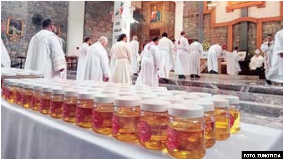
● En la Misa Crismal, se bendice el Aceite de los Catecúmenos y el Aceite de los Enfermos, y se consagra el Aceite de Crisma.