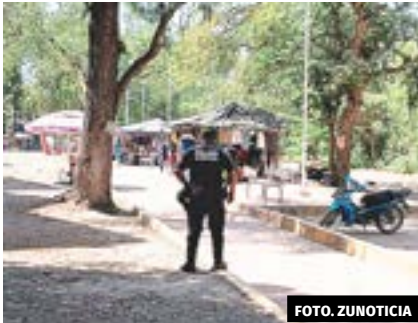
● Elementos de la DSPyTM llevan a cabo rondines de vigilancia en la plazoleta de Guadalupe, para garantizar la seguridad de los visitantes.

Otro de los inconvenientes que los comerciantes viven, es que en el lugar existe siempre la presencia del Escuadrón de la Muerte, y en ocasiones las jovencitas que pasan por ese punto son molestadas por los borrachitos.