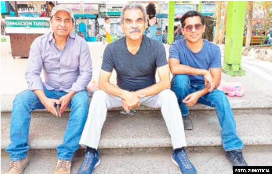
● Misioneros de Reynosa, Tamaulipas, visitan la Huasteca Potosina.

Aseguró que hay una gran participación de los jóvenes, cuentan con un menor de 16 años que está estudiando el evangelio, aunque algunos se quieren incorporar a los 14 años, pero se les orienta a que terminen por lo menos sus estudios de nivel básico, para que tengan un poco más de conocimientos.