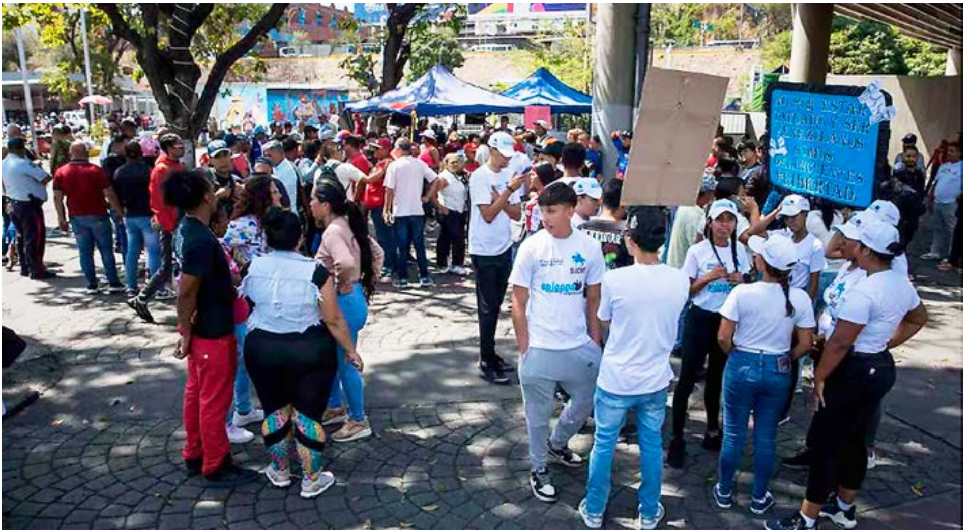
● Personas participan en la recolección de firmas en apoyo a sus compatriotas migrantes deportados desde Estados Unidos a El Salvador este viernes, en Caracas (Venezuela).