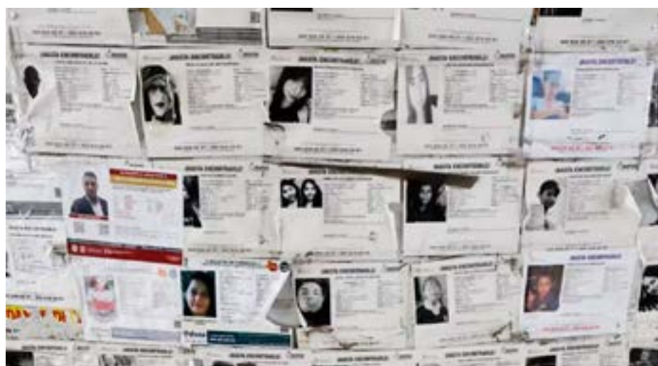
● El proyecto propuesto por Kenia López indica que el presupuesto destinado debe garantizar este derecho. Imagen ilustrativa.

En el proyecto también se indica que el presupuesto destinado a garantizar este derecho “deberá ser suficiente y no podrá ser inferior, en términos reales, al del año inmediato anterior”.