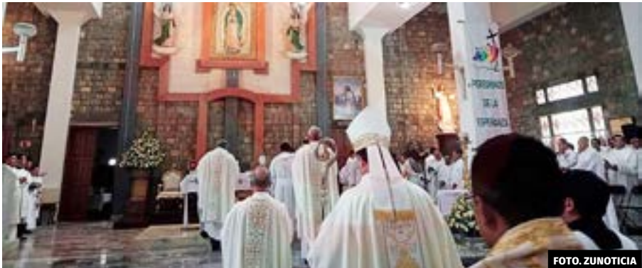
● Presbíteros de los diferentes municipios de la Huasteca realizaron la renovación de promesas sacerdotales para continuar siendo fieles al ministerio que los recibió.