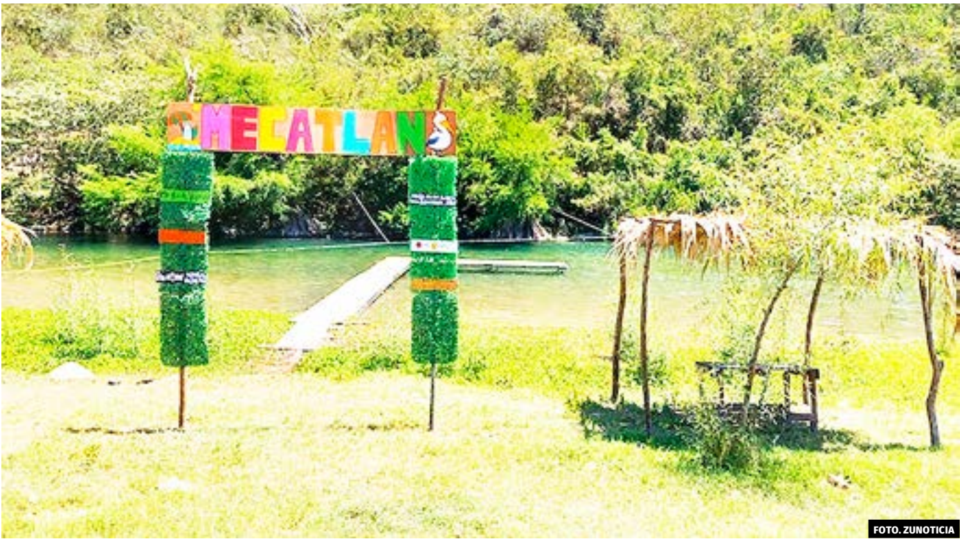
● Familias de Mecatlán se unieron para abrir la playa Los Pelícanos.

● Por cuarta ocasión, las familias de Mecatlán se unieron y trabajaron arduamente para la apertura del paraje turístico.