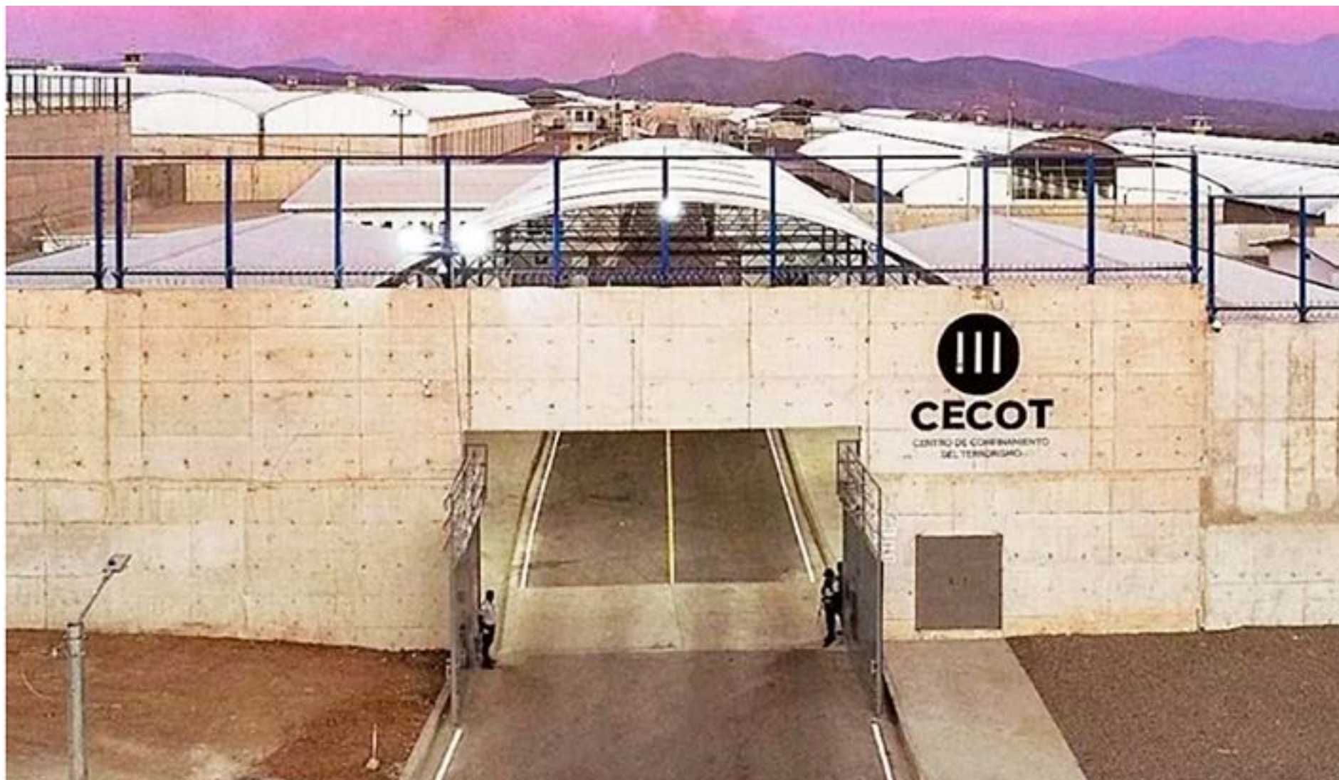
● Cecot, la temible prisión salvadoreña donde han sido encerrados los migrantes deportados de Estados Unidos.