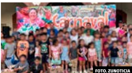
● Cientos de niños fueron partícipes de este evento.