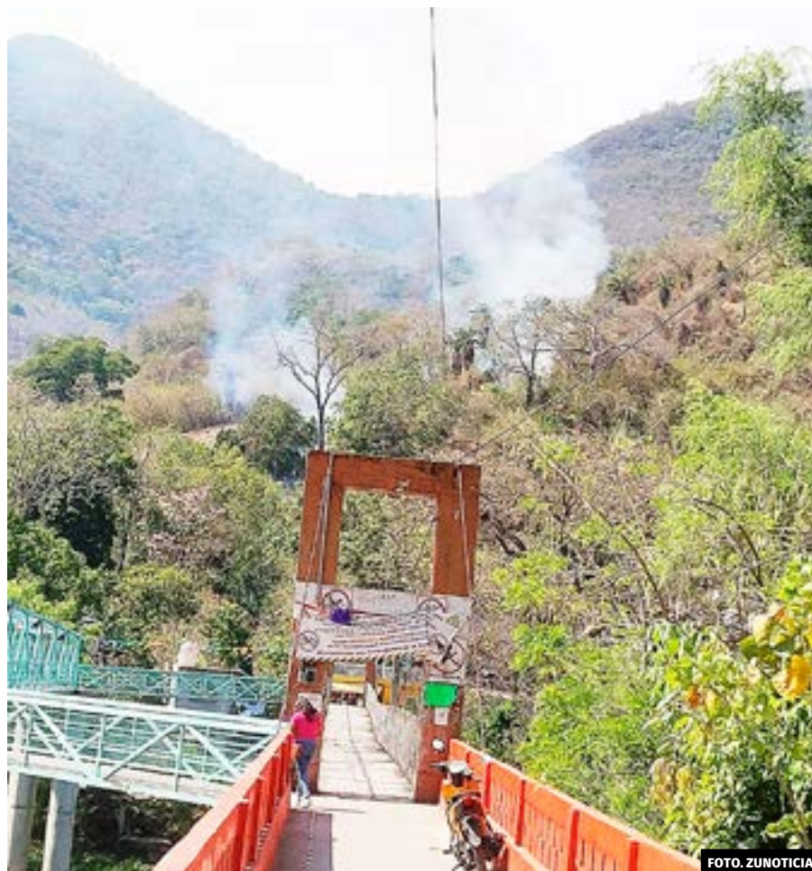
● Quema de basura provocó fuerte incendio en Tacial